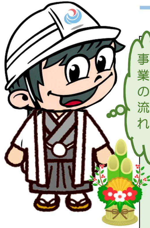
「レビーくん」(レビー：堤防の意)

～2018年7月豪雨災害による漏水の発生を受けて、直轄河川災害復旧事業および直轄河川災害関連緊急事業にて、漏水箇所の遮水工を実施しています～