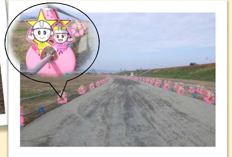
バリケードは「ももち・うらっち」で統一しています

★工事に関するお問い合わせ★ 国土交通省 中国地方整備局 岡山河川事務所 高梁川災害復旧対策出張所 ☎086-465-1880 担当：山下建設監督官 または、現場職員へお気軽に！