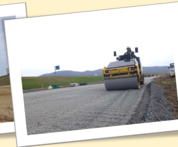
十分に転圧していきます