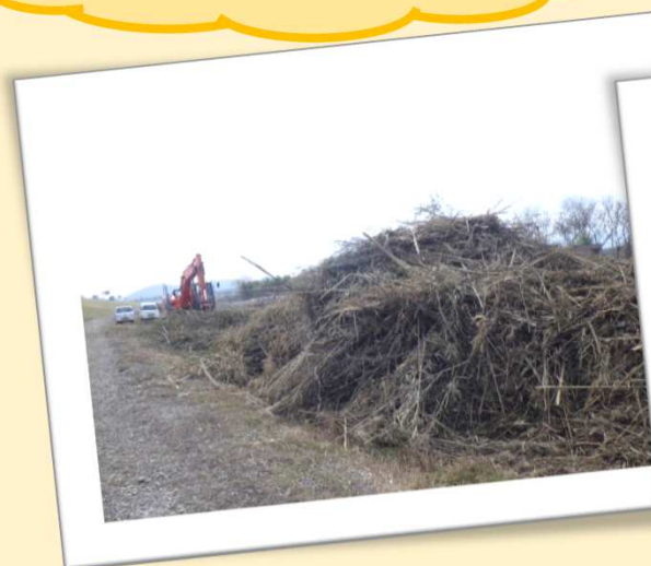
多くの草木を除去しました

工事では大変ごめいわくを おかけいたしております。 工事の進み具合などを 定期的にお知らせするため 地域の皆様に 配布・掲示・回覧等にて 情報提供いたします。