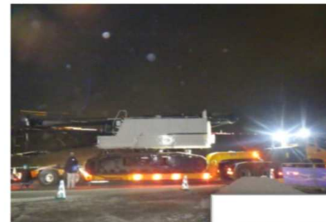
大型クレーンを搬入し 現地で組み立てます