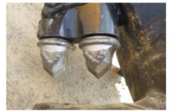
先端の超硬ビット で破砕掘削します