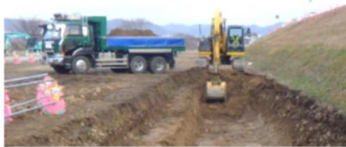
矢板高さに合わせ筋掘します