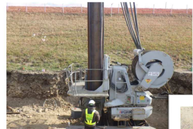
掘削併用圧入機で、施工していきます