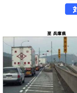
至 広島県(国道2号本線)