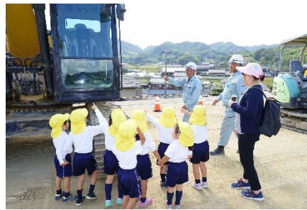
《建設機材の見学イメージ》