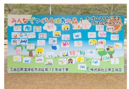
《お絵描き掲示板イメージ》