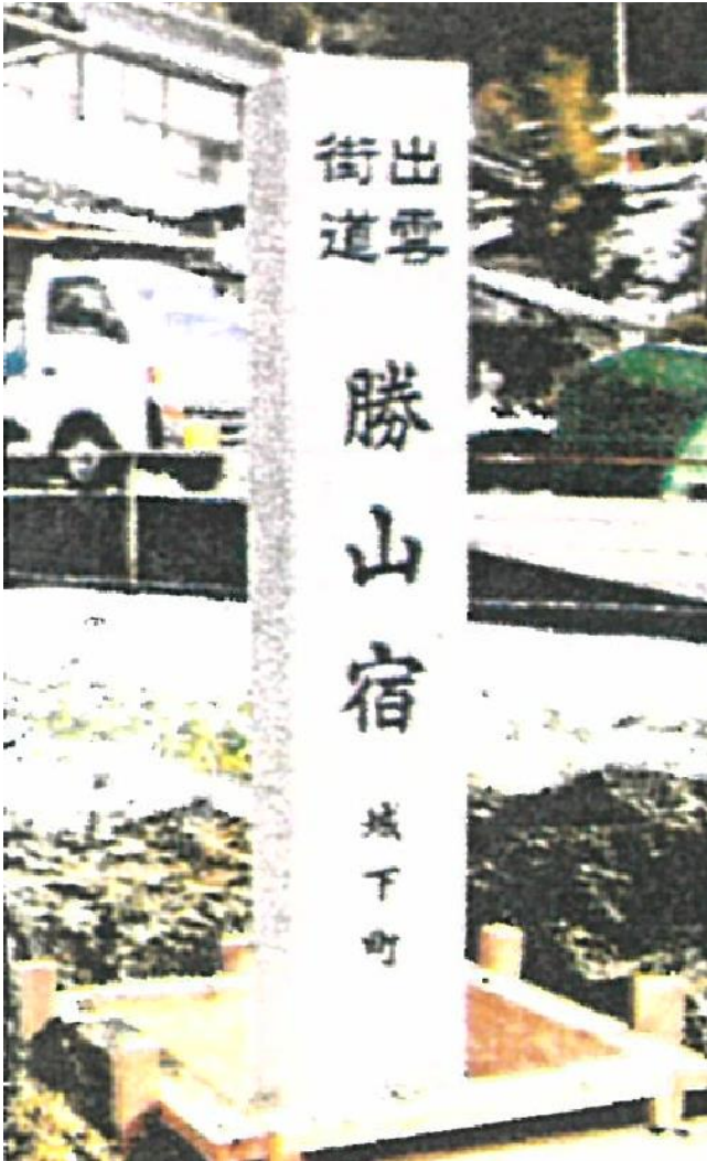
沿道を歩く人の道しるべとして設置 (平成の道しるべ 平成24年、25、27年度設置。)