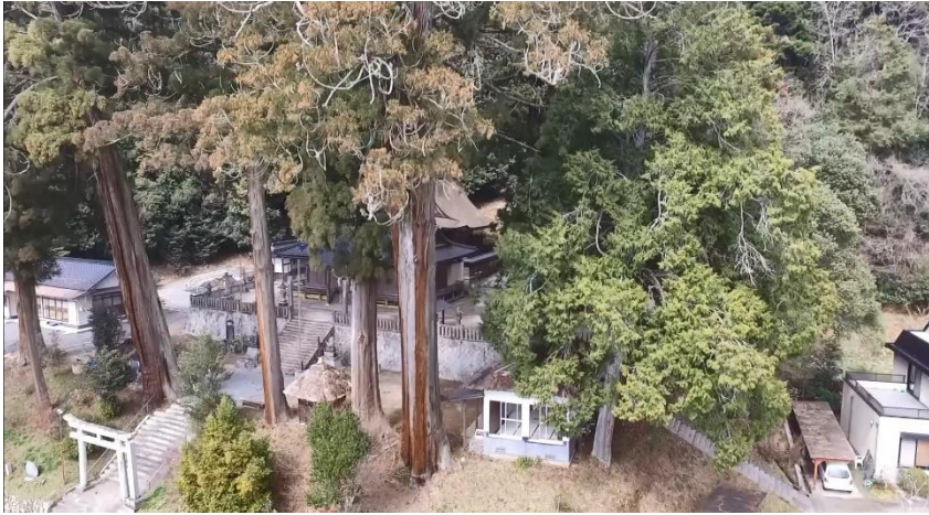
ドローン撮影も駆使した街道資源の映像化による DVD 作成