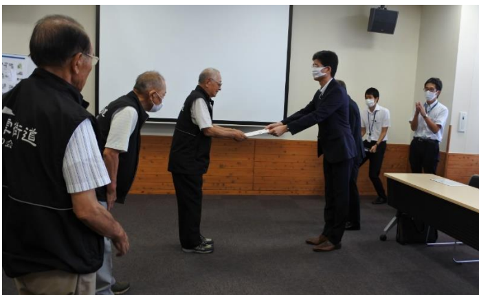
認定証授与の様子