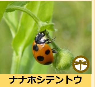
ナナホシテントウ