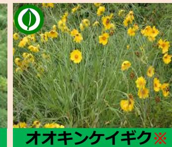
オオキンケイギク※