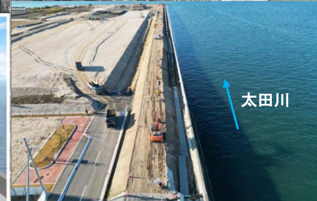
堤防施工状況 (令和4年12月撮影)

このパースは広島市提供のスポーツ広場整備イメージ(令和2年11月時点)を参考に国土交通省にて作成したものです。