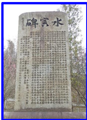
自然災害伝承碑 (水害碑：広島県坂町)