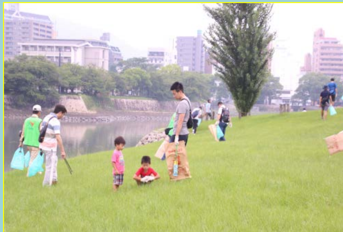
基町環境護岸(中央公園)