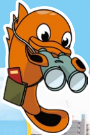
太田川キャラクター 「ゴギちゃん」