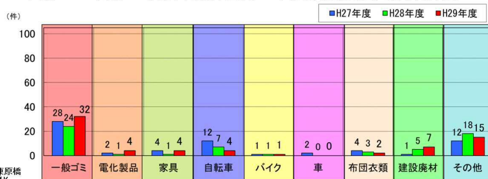
平成29年度 可部出張所管内 不法投棄発見回数集計表

※ このゴミマップは、平成29年度(平成29年4月~平成30年3月)に河川パトロール等により、ゴミ不法投棄を発見した場所を表しています。