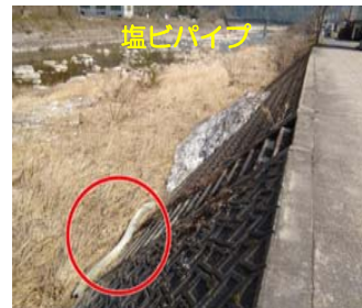
加計出張所管内 不法投棄ゴミ種類別件数