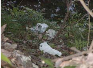
斜面や木の枝はゴミだらけだ！