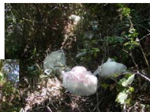
車の窓から川に投げ捨てる！ 斜面や途中の木にゴミが沢山ある！