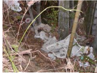
斜面は、ゴミの山だ！

ゴミは立派な資源です。捨てれば沢山の人の手が係り、お金が係ります。 ゴミは、分別し決められた収集日に資源として出しましょう