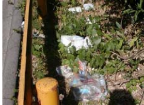
道路沿いに捨てる！