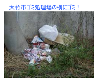
大竹市ゴミ処理場の横にゴミ！