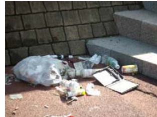
和木遊歩道のゴミ！