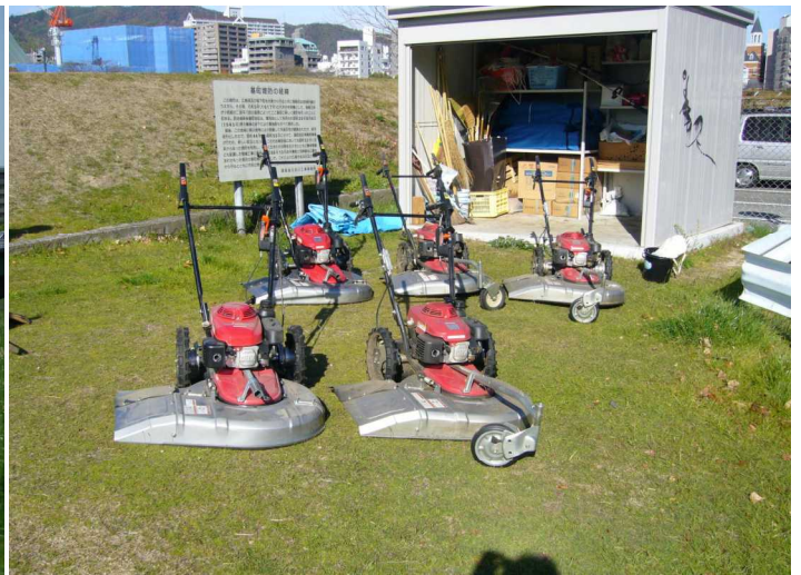
<ハンドガイド式除草機械>