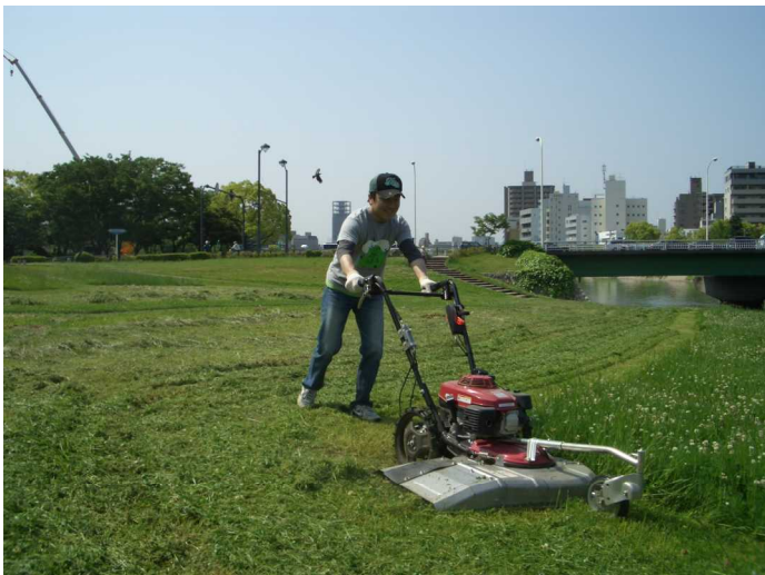
<除草機械の利用例>

太田川河川事務所が所有する除草機械（ハンドガイド式）を1週間単位で無料で貸出します。