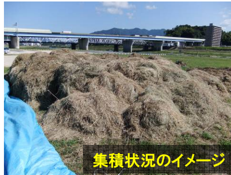
集積状況のイメージ