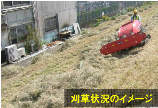
刈草状況のイメージ