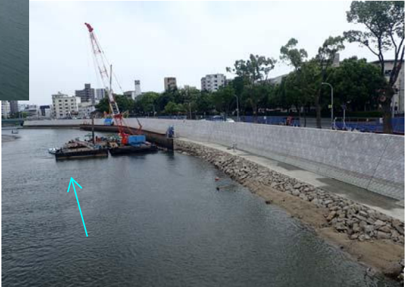
天満川右岸施工状況(広瀬橋下流)