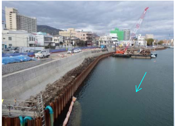
天満川右岸施工状況(広瀬橋上流)