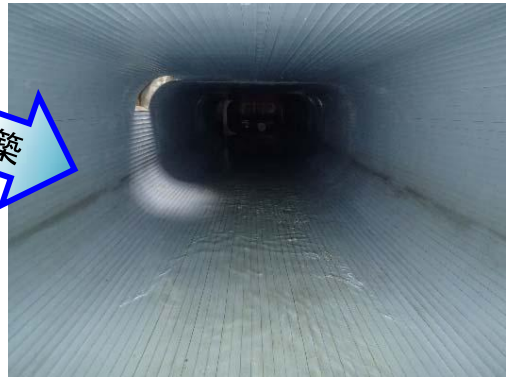
府中1号幹線(施工後)