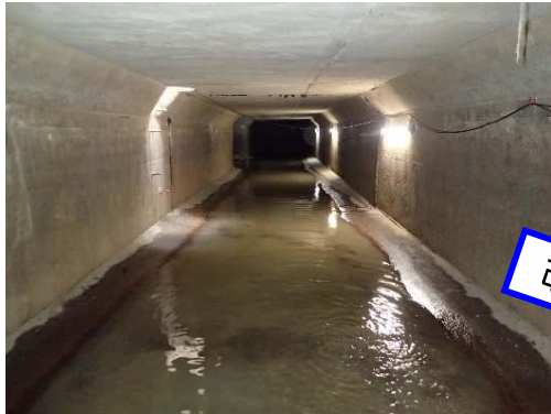
府中1号幹線(施工前)

府中排水区、茂陰排水区、青崎・鹿籠排水区においては、雨水幹線函渠が非耐震施設であり老朽化も進んでいるため、耐震性能を有する函渠へ改築を実施中(府中1号幹線H30年度より実施中)です。