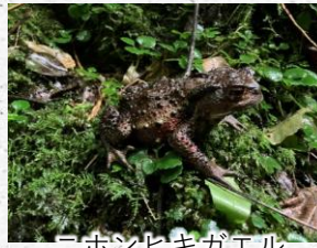
ニホンヒキガエル