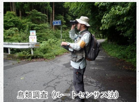
鳥類調査（ルートセンサス法）