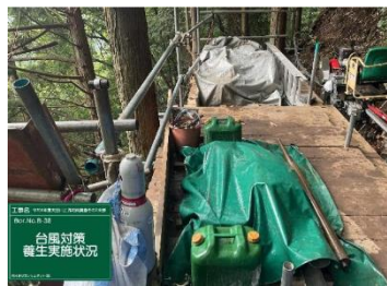
台風対策養生状況 (B-38)