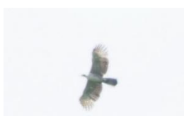
押ヶ峠付近で確認された若鳥