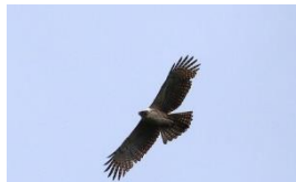
那須付近で確認された若鳥

7月の調査結果、田吹・那須・坂根～立岩山付近で合計26例のクマタカを確認しました。また、クマタカ以外の猛禽類ではミサゴ、ハチクマ、オオタカ、サシバの4種を確認しました。