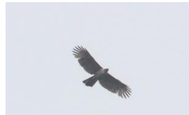
田吹付近で確認された若鳥