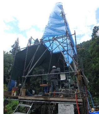
ボーリング調査が終了した B-40 地点