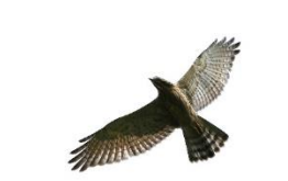
田吹地区で確認されたサシバ