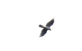
那須地区で確認されたオオタカ