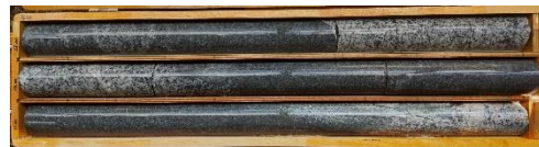
ボーリングコア写真【B-40 地点】