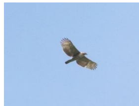
押ヶ峠地区で確認されたクマタカ