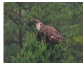
那須地区で確認されたクマタカ