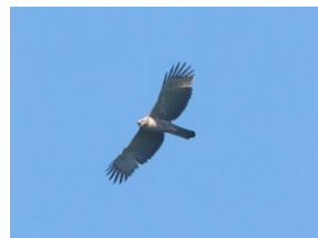
坂根地区で確認されたクマタカ