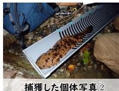
捕獲した個体写真②