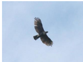
田吹地区で確認されたクマタカ

柴木川合流点付近から立岩ダム上流までの広い範囲で147例（6月_28例、7月_26例、8月_48例、9月_45例）のクマタカが確認され調査範囲周辺に広く生息していることが考えられます。