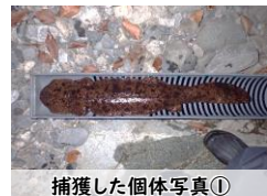
捕獲した個体写真①

捕獲した全ての個体にはマイクロチップの装着とDNA分析用の組織片サンプルの採取を行い、捕獲場所付近に放流しました。