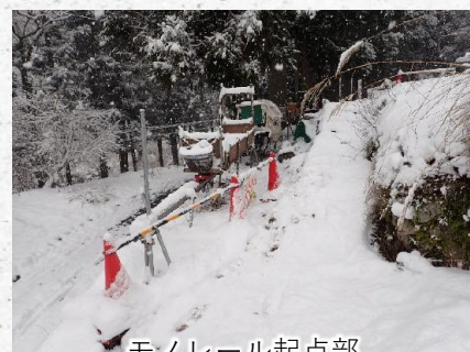
モノレール起点部