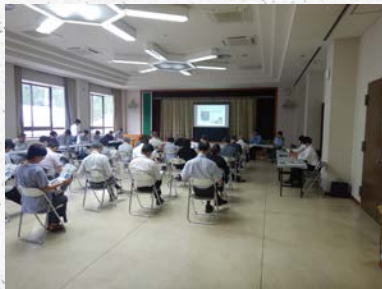
昨年の報告会の様子