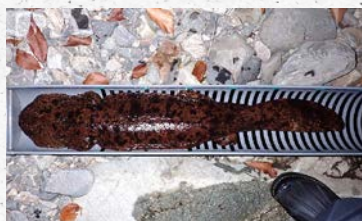
オオサンショウウオ