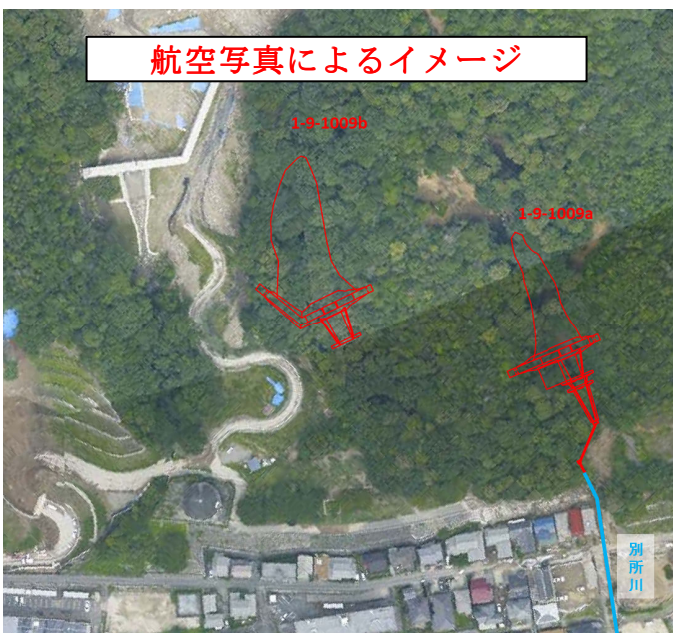
航空写真によるイメージ