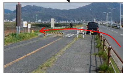
小田第二駐車場入り口 (スタート地点)