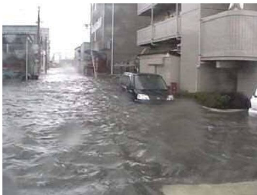
平成16年の高潮状況 (広島市南区出島付近)

平成に入ってから、平成3年9月の台風第19号による高潮被害の他、平成11年9月の台風第18号、平成16年8月の台風第16号と9月の台風第18号により高潮被害が繰返し発生しました。