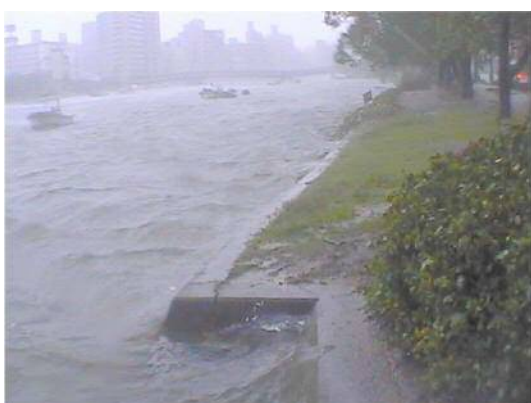
平成16年の高潮状況 (広島市西区東観音付近)