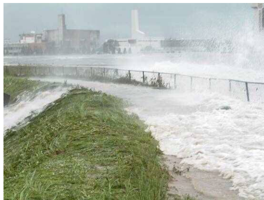
平成16年の高潮状況 (広島市西区観音付近)