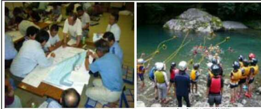
マイ防災マップづくり