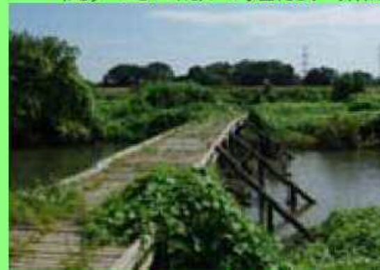
ピオトープの整備