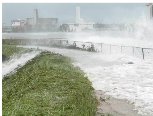
平成16年の高潮状況 (広島市西区観音付近)