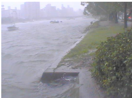
平成16年の高潮状況 (広島市西区東観音付近)