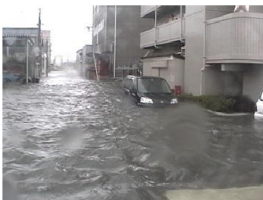
平成16年の高潮状況 (広島市南区出島付近)

平成に入ってから、平成3年9月の台風第19号による高潮被害の他、平成11年9月の台風第18号、平成16年8月の台風第16号と9月の台風第18号により高潮被害が繰返し発生しました。