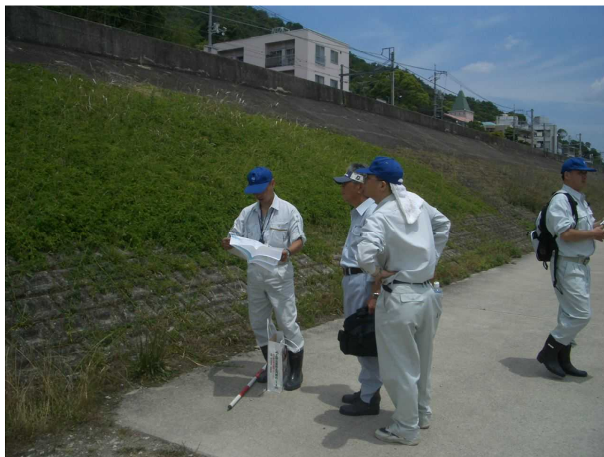
太田川放水路左岸側