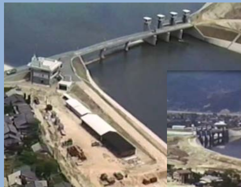
完成直後の大芝水門と祇園水門