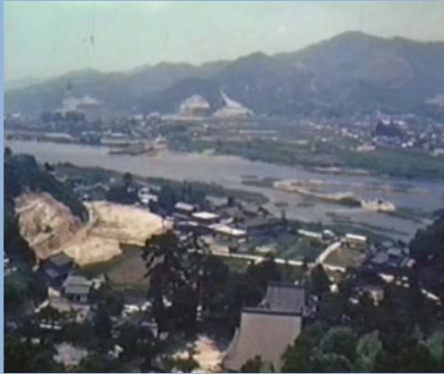
工事着手前の様子