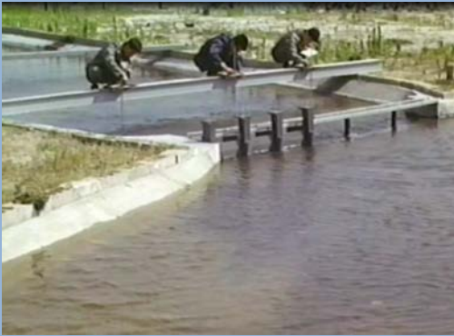
大芝水門の模型実験の様子