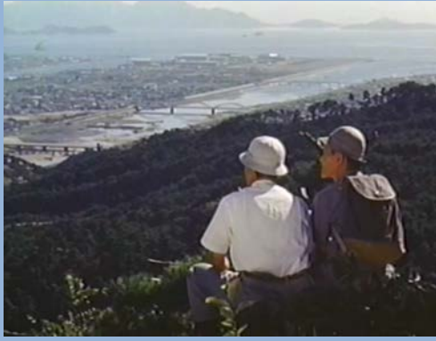
己斐から福島川(現放水路)を望む