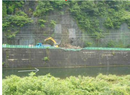
車両転落箇所付近