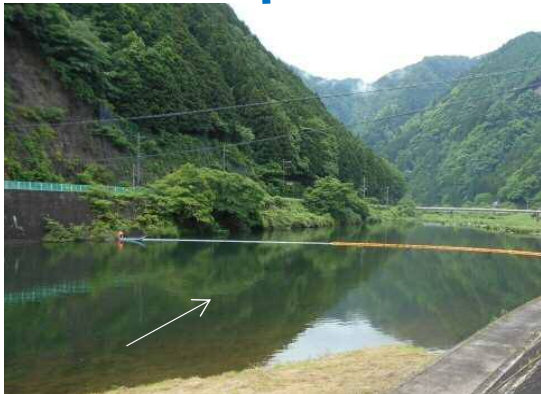
オイルフェンス及びオイルマット設置