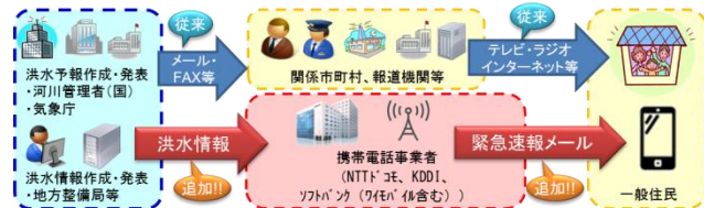
「洪水情報のプッシュ型配信」イメージ

配信対象内の携帯電話等 （NTTドコモ、KDDI、ソフトバンク（ワイモバイル含む））のユーザーを対象