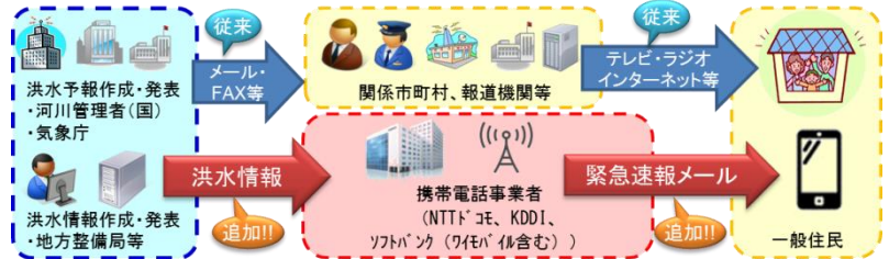
「洪水情報のプッシュ型配信」イメージ

ワイモバイル： http://www.ymobile.jp/service/urgent_mail/