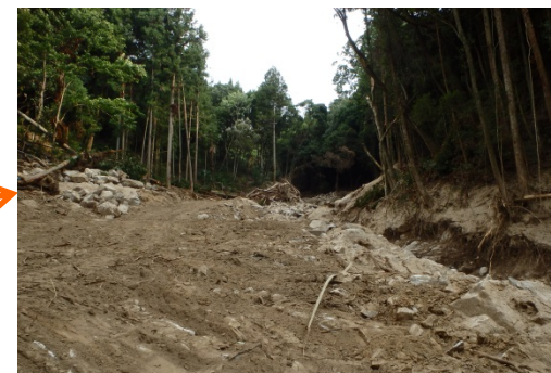
ワイヤーネット進入路整備の促進