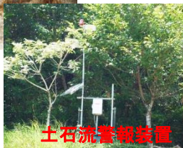
土石流警報装置設置完了(7/19)