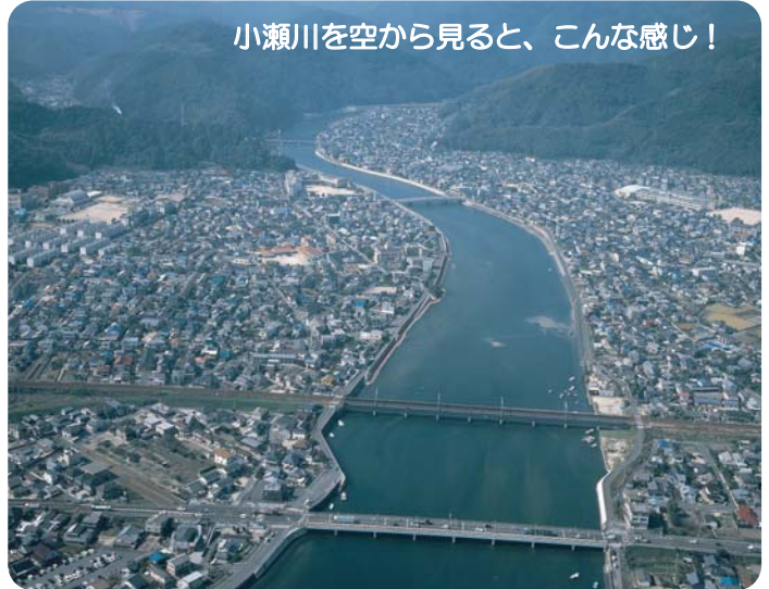
小瀬川を空から見ると、こんな感じ！

今後は“おぜがわ通信”をとおして、小瀬川水系河川整備計画の作成に関わる会議状況や計画の内容などの情報をお伝えします。