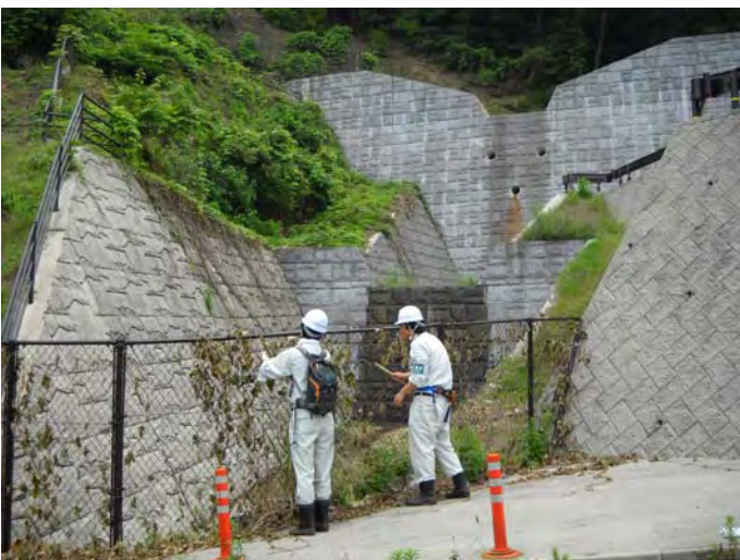
安全施設を確認し、安全施設に巻き付いた草は除去しました。(四季が丘2号砂防えん堤)