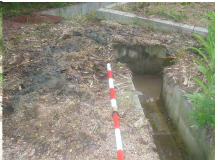
管理施設の側溝に土砂が堆積していたため、掃除をしました。(玖波砂防えん堤)