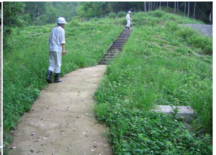
里道ののり面が崩れていなか、階段に損傷がないか確認しました。(高取1号砂防えん堤)