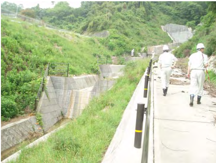
のり面のゆるみは確認されませんでした。また、流路工の洗掘、ひび割れは確認されませんでした。(宮園3号砂防えん堤)