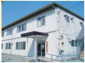
広島西部砂防出張所