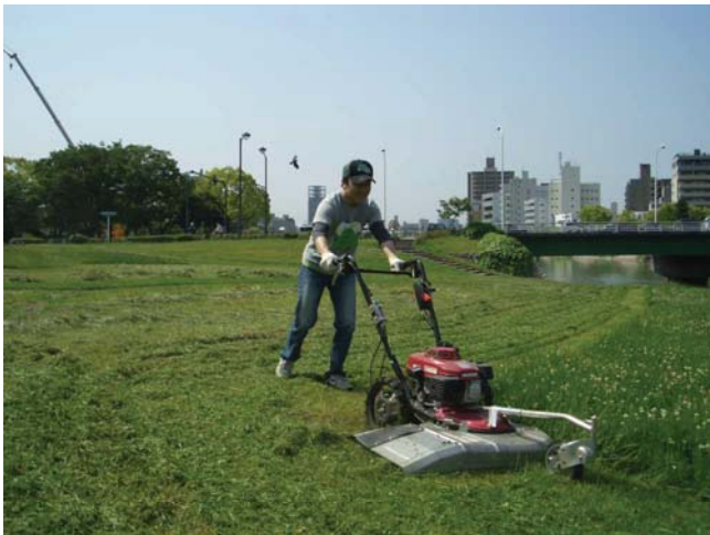
< 除草機械の利用例 >

太田川河川事務所が所有する除草機械（ハンドガイド式）を1週間単位で無料で貸出します。