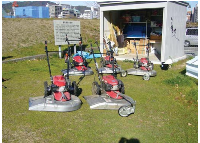
< ハンドガイド式除草機械 >