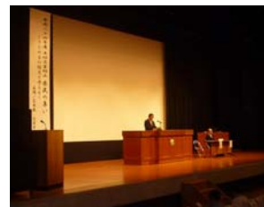
平成24年度 県民の集い(庄原市)

このため、土砂災害防止に関する防災知識の普及、警戒避難体制整備の促進等を強力に推進することを目的として、次のとおり「土砂災害防止県民の集い」を開催します。