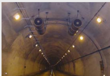
トンネル換気設備