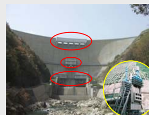
ダム用ゲート設備