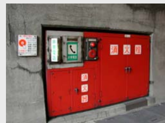
トンネル非常用設備