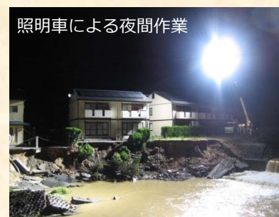
照明車による夜間作業

いざ災害が起きたときに中国技術事務所が保有する災害対策機械を出すための防災計画を立てたり、日本の技術力向上のために大学や民間、県市と連携して交流会を開催しています。