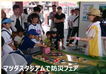
マツダスタジアムで防災フェア

係長になってからは、出前講座や水辺の安全教室など地域連携の仕事も多くやっていますが、地域の方に喜ばれると嬉しくなります。