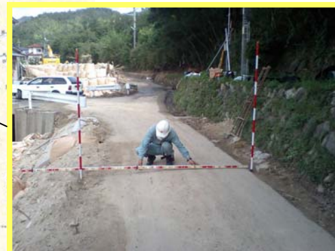
なみがわ ▲奈美川 現地測量の状況