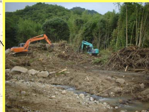
うだみなみがわ ▲上田南川 進入路工事の状況