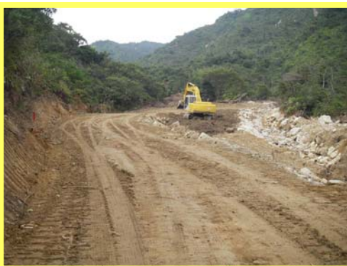
つるぎがわ ▲剣川 進入路工事の状況