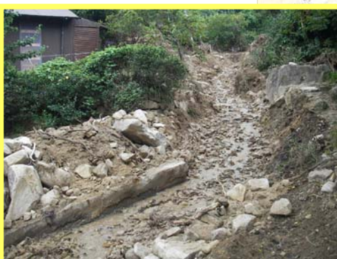
かみさとがわ ▲神里川 水路付替完了