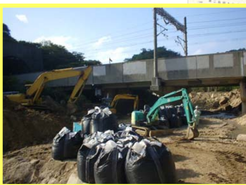
まがわ ▲素川 進入路工事の状況