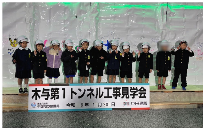
阿武小学校1・2年生