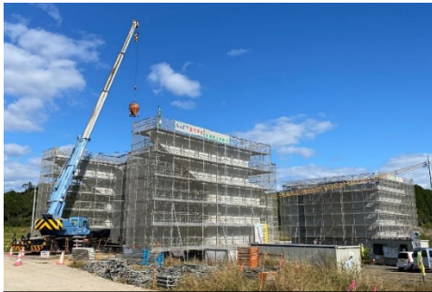
栗野川橋下部外工事 施工状況