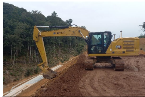
金道地区第2改良工事 ICT施工状況