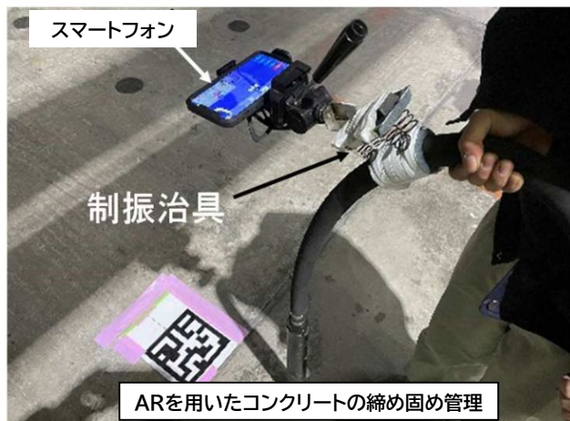
ARを用いたコンクリートの締め固め管理

※取材に当たっては駐車場の準備がございましたので、別紙-2に記入のうえ10月3日(月)12時までにFAXにて送信願います。