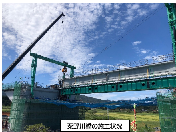
粟野川橋の施工状況