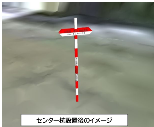
センター杭設置後のイメージ