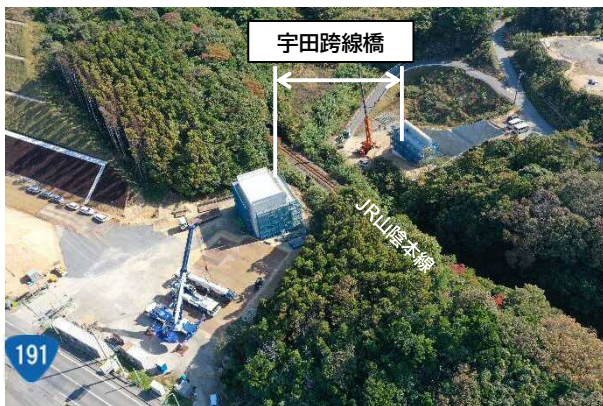
宇田跨線橋の状況