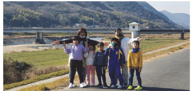
最優秀賞 希望の2021年 呉妹たんぽぽ児童クラブさん (令和3年1月撮影)

今後はご応募いただいた多くの作品をとりまとめ写真集を作成し、各所での無料配布を予定しています。