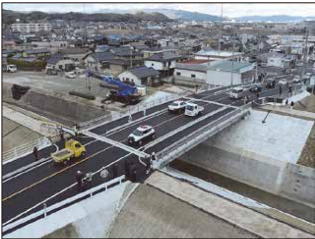
有井橋開通状況（令和4年12月26日）

イベントでは、地元小学生有志による合唱や橋に取り付ける橋名板を披露するなど、当日は大変多くの方々に集まっていただきました。