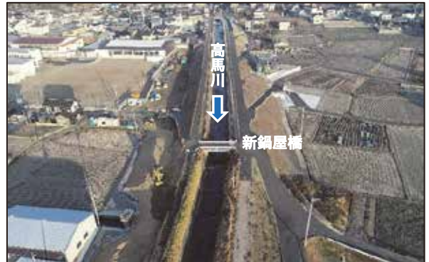
高馬川の進捗状況 (令和5年1月撮影)