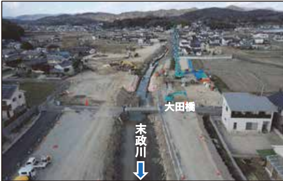
未政川の進捗状況 (令和5年1月撮影)