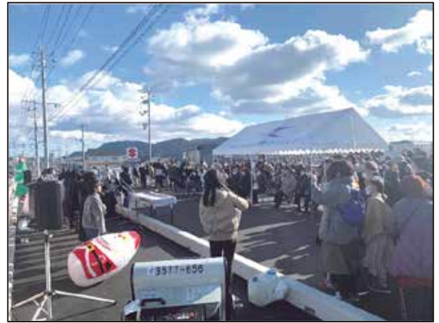
記念イベント状況（令和4年12月18日）