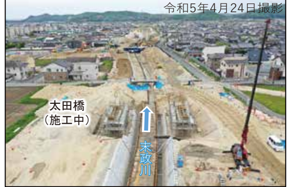
未政川の進捗状況 (太田橋周辺)