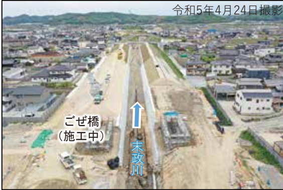
未政川の進捗状況 (ごぜ橋周辺)